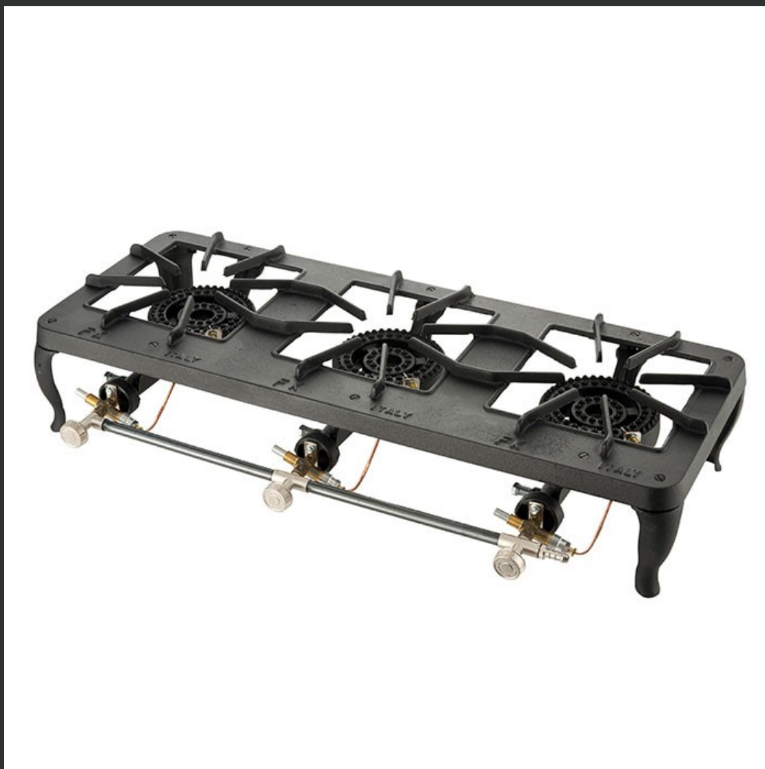
ΤΡΙΠΛΗ ΕΣΤΙΑ ΑΕΡΙΟΥ ΜΕ ΘΕΡΜΟΚΟΠΙΑ-ΠΙΛΟΤΟ MOD. EUROPA