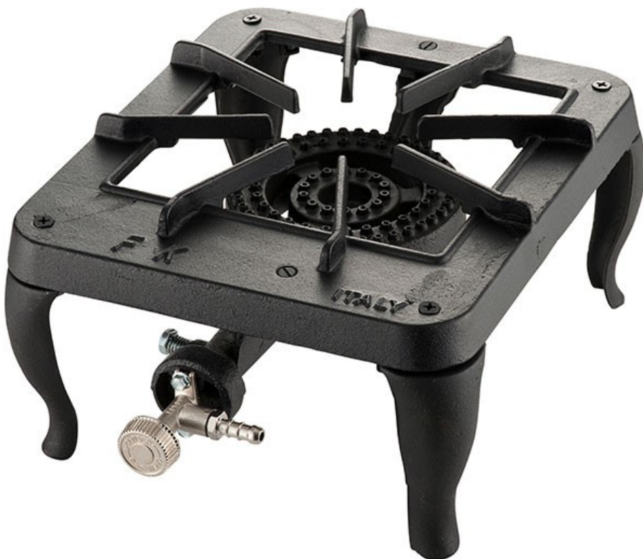
ΜΟΝΗ ΕΣΤΙΑ ΑΕΡΙΟΥ ΜΟΔ. EUROPA Art. 03040-03045

ΠΡΟΣΟΧΗ Οταν το άνοιγμα ή το κλείσιμο του ρουμπινέτου γίνεται με δυσκολία μην ασκήσετε δύναμη αλλά καλέστε επειγόντος την τεχνική βοήθεια. Ελέγχετε συχνά την κατάσταση του λαστιχένιου σωλήνα και αν είναι απαραίτητο αλλάξτε τον πριν την ημερομηνία ληξέως του. Οτα η συσκευή παραμένει εκτός λειτουργίας για πολύ καιρό κλείστε το γενικό ρουμπινέτο αερίου.